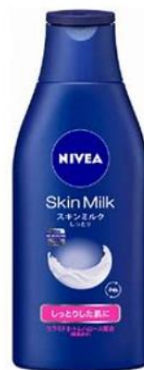
保湿クリームサンプル