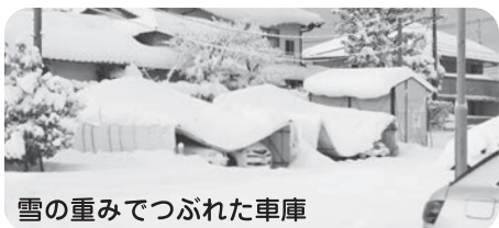
雪の重みでつぶれた車庫

れたため、お昼過ぎには除雪が完了しました。理事長先頭に参加された皆さん、本当にご苦労様でした。