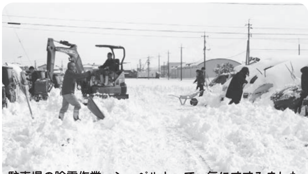
駐車場の除雪作業。ショベルカーで一気にすすみました

2月7日、斐川町を襲った寒波は見る見るうちに膝下まで雪が積もり、あまりの積雪に帰れなくなる職員が続出しました。ひかわ医療生協では、緊急に防災対策会議を開催し、帰宅困難職員の食事や病院内での宿泊場所を決めるなど、対策を行い、40人の職員が宿泊しました。翌8日は前日降り積もった雪の除雪作業を行いました。幸い、ショベルカーを急遽借り