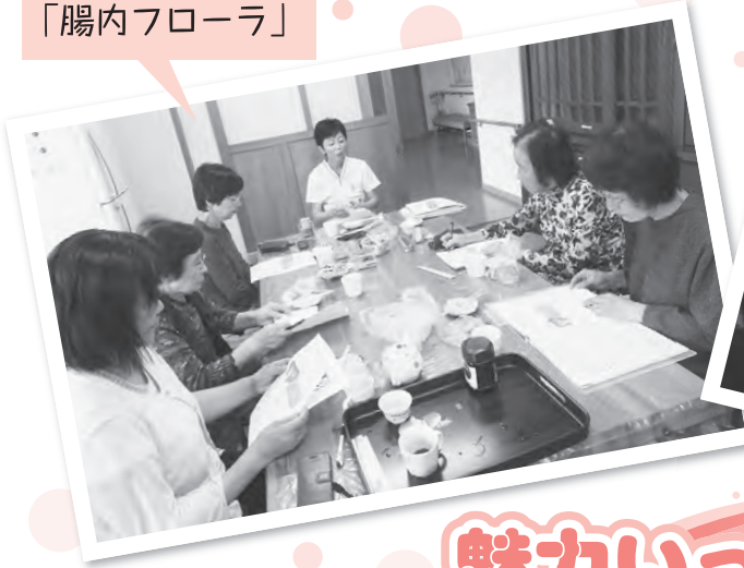
出西すいせん班 「腸内フローラ」