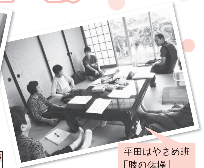
平田はやさめ班 「膝の体操」