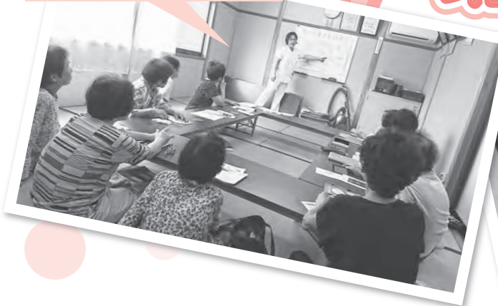
荘原おちらと班 「加齢に伴う目の病気」