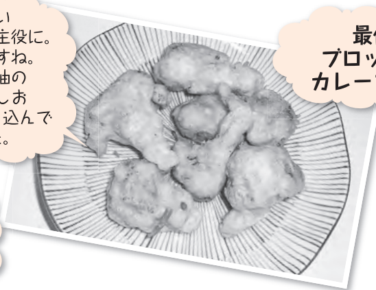
最優秀賞 ブロッコリーの カレーフリッター

料理の中に調味料を 入れるのではなく、 表面に味をつけるという所が すこしおポイントです。 手軽にできそうです。