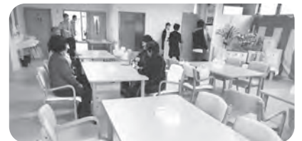
さふらんのリビング

1月から、「さふらん」の入居申込を始めましたが、多数の相談があり、面談を行う中で、高齢者の「住まい」問題の切実さを実感させられました。