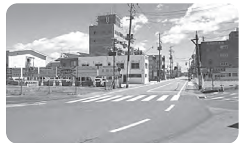
(車も通らない浪江町中心部)

東京電力から支払われる見舞金も避難指示が解除された地域では、月額13万円の見舞金の支払が中止されました。原発事故で収入のすべてを失った被災者は見舞金が頼りです。避難地域の自営業者は被災前の売り上げに応じ、東京電力が補償金を払っていましたがこれも打ち切りです。生活再建が出来ない状況での一方的打ち切りは「死ね」と同じです。さらに、東京電力は賠償を話し合いで解決する「ADR」(裁判外紛争解決手続)を17000件拒否しました。被災者は裁判するしか方法がありません。裁判には、時間と多額の訴訟費用がかかります。東京電力はそれを見越して、被災者に『泣き寝入り』させようとしています。これは断じて許せません。