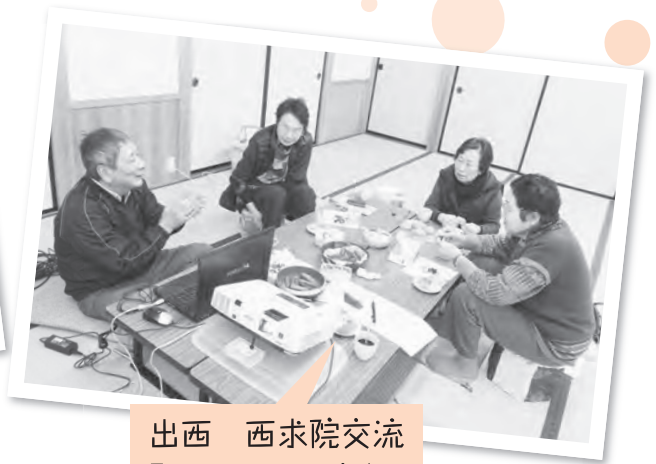
出西 西求院交流 「骨粗しょう症」