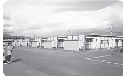
(福島市の仮設住宅)

現在も県内外に約6万人避難者がいるにも関わらず、東電・国・県は被災者への支援打ち切りを次々に進め、被災住民を苦しめています。