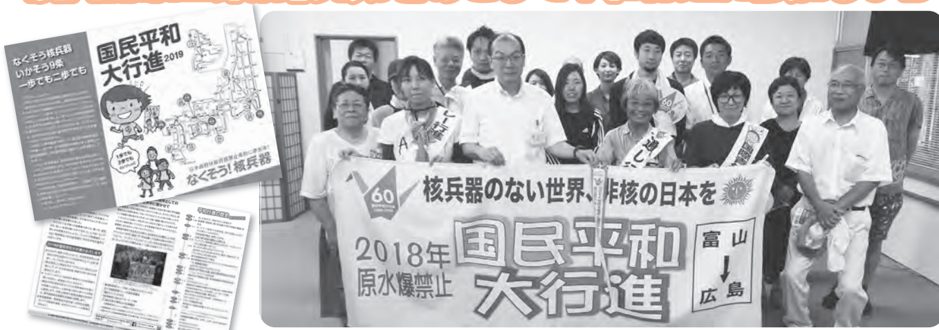
2018年平和行進 斐川支所にて

毎年7月25日、ひかわ医療生協では『原水爆禁止国民平和行進』に取り組んでいます。