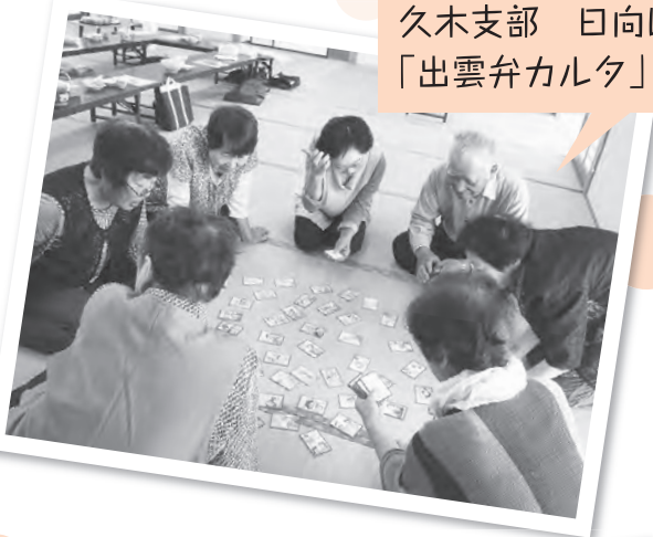
久木支部 日向ほっこ班 「出雲弁カルタ」