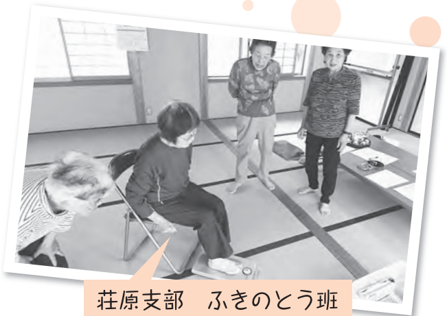
荘原支部 ふきのとう班 「足指力測定」