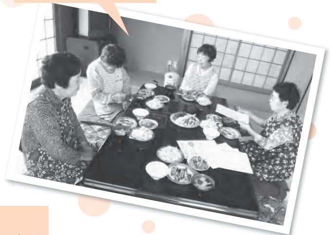
平田 はやさめ班 「アスパラ料理」