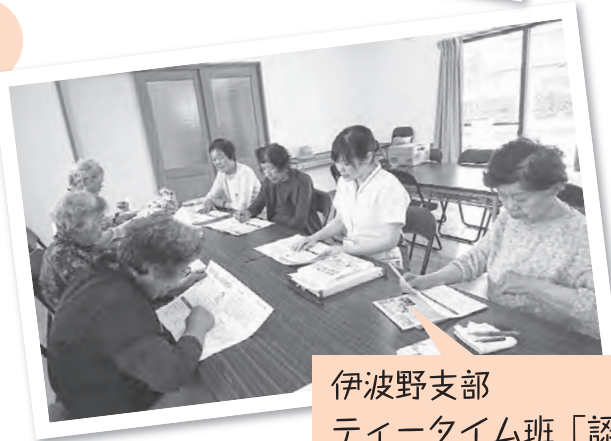
伊波野支部 ティータイム班「認知症」