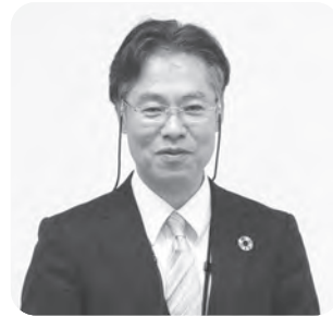
島根大学教育学部 松本一郎 教授

4月～6月、職員対象に「SDGS」学習会を島根大学教育学部の松本一郎教授を講師に行いました。松本教授は環境教育を専門にされており、2015年国連サミットで確認された「SDGS」（持続可能な開発目標）推進にも関わっておられます。