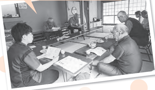
直江支部 西本町班 「寝たきりにならないための体操」