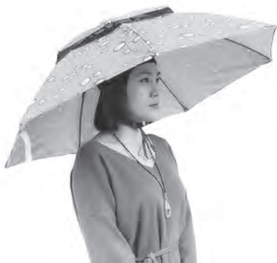
(ニュースでも話題の「かぶる傘」)

通気性の良い素材で締め付けない涼しいものを選びましょう。色は熱の吸収を防ぐ白っぽい物が良いでしょう。