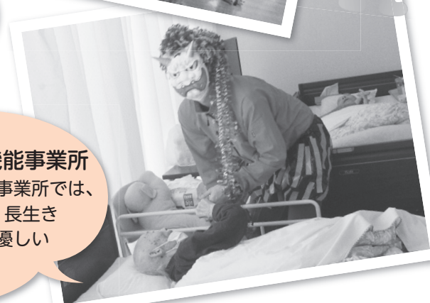
看護小規模多機能事業所 看護小規模多機能事業所では、「今日は節分だね。長生きすーだよ」と鬼も優しい声掛け！