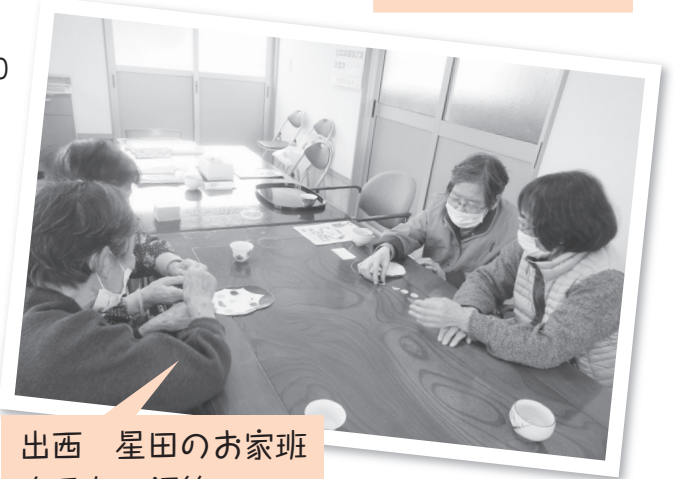
出西 星田のお家班 かるた、福笑い