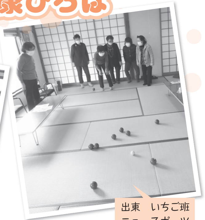
出東 いちご班 ニュースポーツ