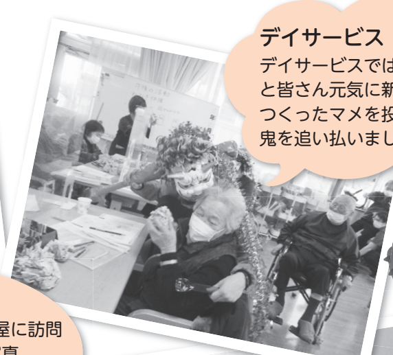
あつとホームひかわと、さふらんでは、鬼がお部屋に訪問「せっかくだけん一緒に写真とってごしない」と入居者さまに喜んでいただきました。