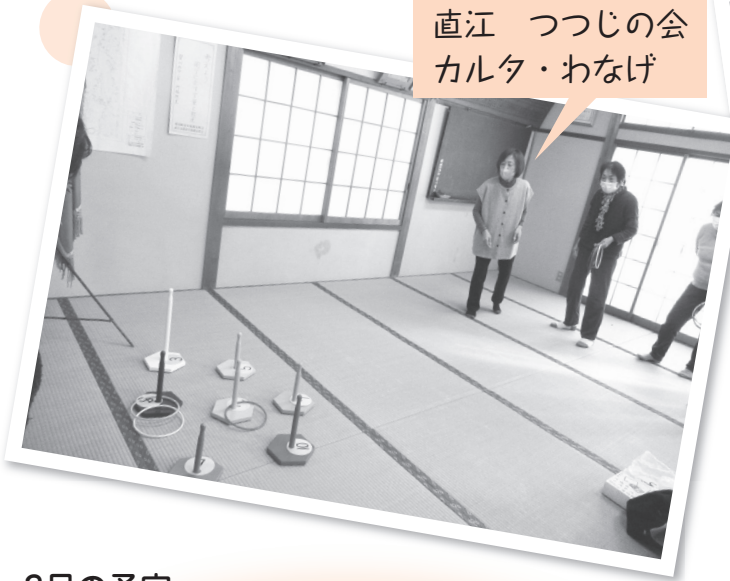
直江 つつじの会 かるた・わなげ