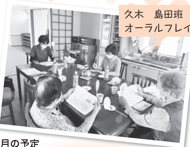
久木 島田班 オーラルフレイル