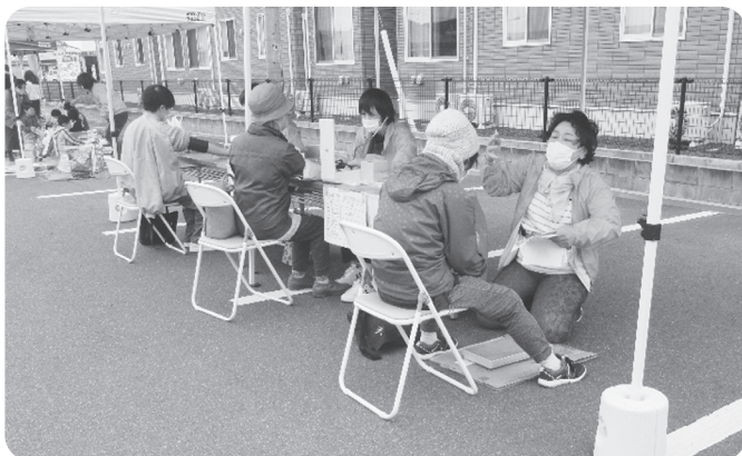
組合員による健康チェックコーナー