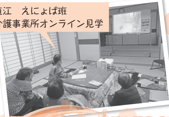
直江 えによば班 介護事業所オンライン見学