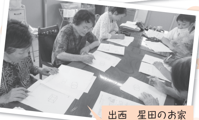
出西 星田のお家 認知症について