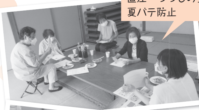
直江 つつじの会 夏バテ防止