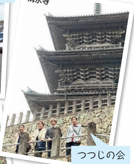
つつじの会 遠足班会