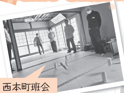
西本町班会 モルック