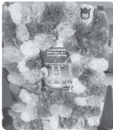
ひかりん きゅう坊も参加